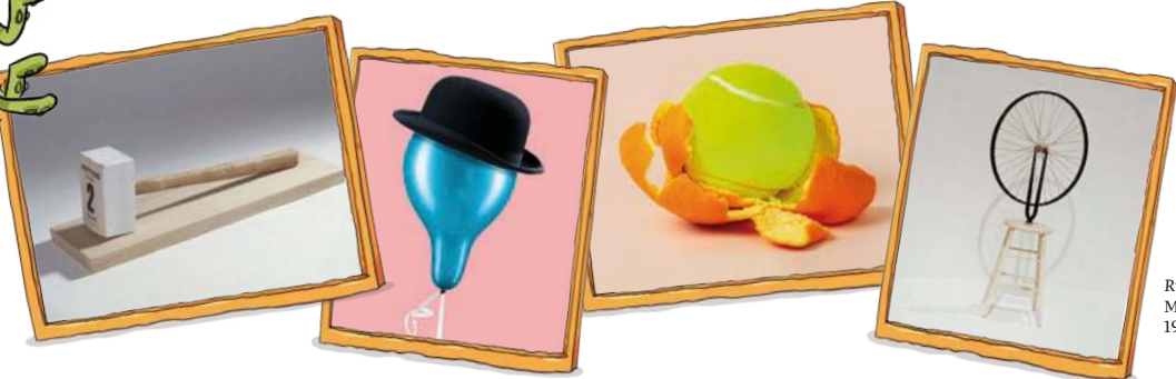
Rueda de bicicleta, Marcel Duchamp, 1913.

En el próximo libro de la colección Agus y los monstruos nuestros protagonistas tienen que buscar un ready-made que al parecer Salvador Dalí creó cuando era pequeño.